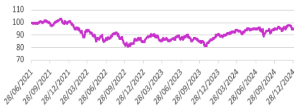
Performance du fonds