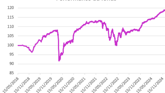
Performance du fonds