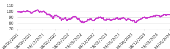
Performance du fonds